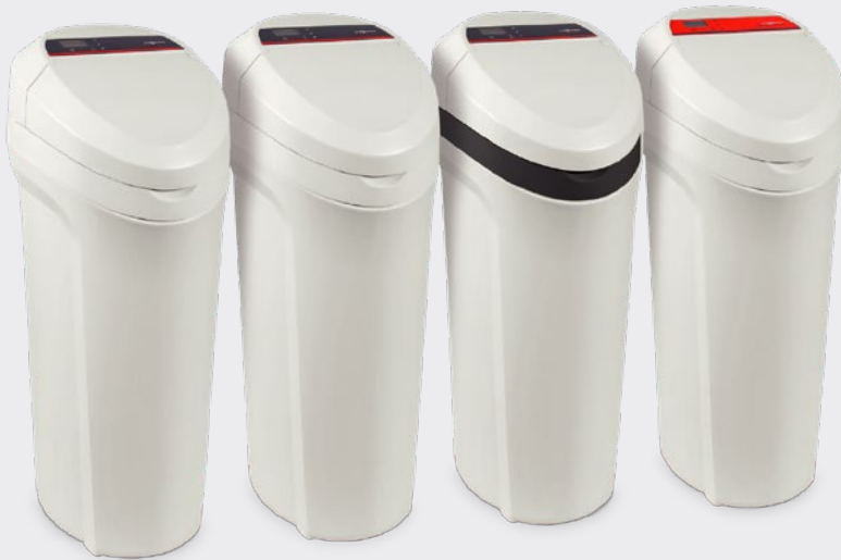
Aquahome MIX SMART